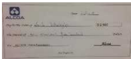
Det synlige beviset på gaven fra Alcoa Foundation

Vi jubler og takker Alcoa Foundation så mye for denne gaven. Slike overraskelser er alltid hyggelig å få.