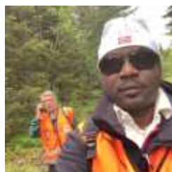
Sanitetsvakt på sykkelritt