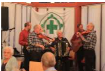
Musikk på eldredagen