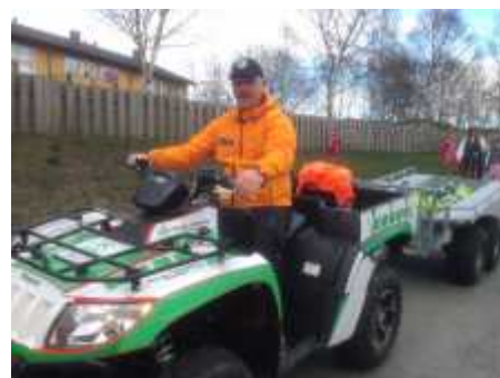
Fra borgertoget 17 mai