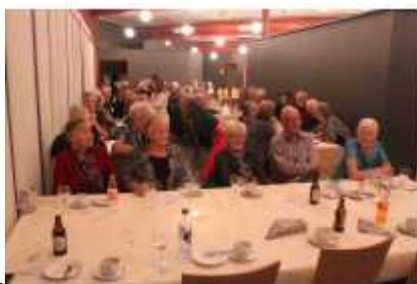
Ca 75 festkledde klar til årets fest

Også i 2015 ble vi anmodet av Eldrerådet om å arrangere feiringen av den internasjonale Eldredagen 1 oktober. Forespørselen kom meget sent, slik at vi måtte flytte markeringen til tidligere "Traffikanten" Kafè. For deltagerne virket ikke dette som noe problem. Ca 75 festkledde eldre fant veien dit fredag 2 oktober, og samtlige som vi snakket med ga uttrykk for at festen hadde vært vellykket. De gleder seg allerede til neste års.