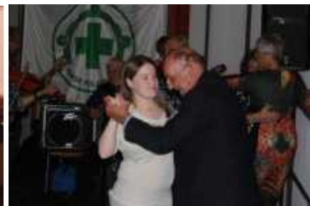
Og etter festen var det tid for en svingom sammens med ungdommene våre