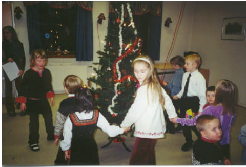
”Så går vi rundt om en enebærbusk.....”

Størst stas ble det når julenissen kom med pakker til alle barna, noen ble litt redd, men det gikk som regel fort over.